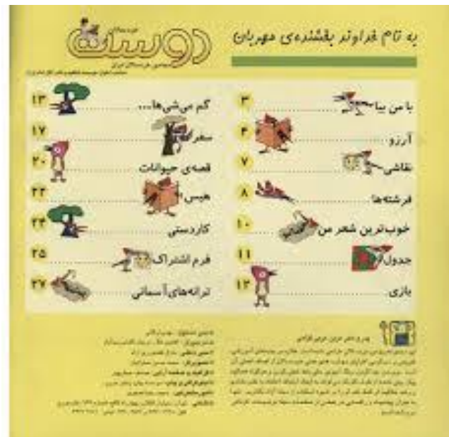
نمونه هایی از فهرست تک صفحه ای