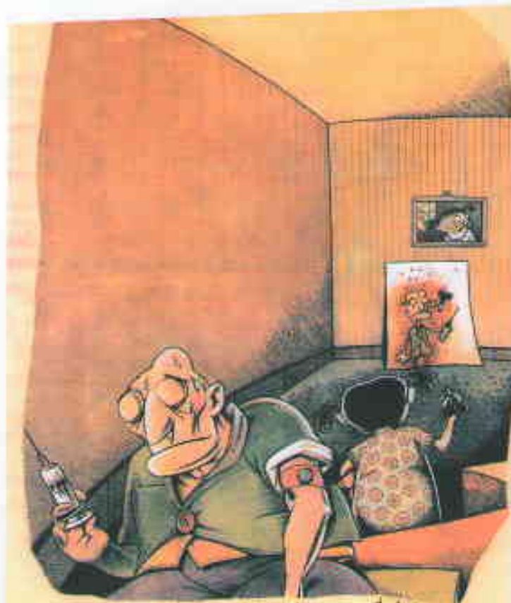
حاجار حجتی ایران JAMAL RAHMATI/IRAN