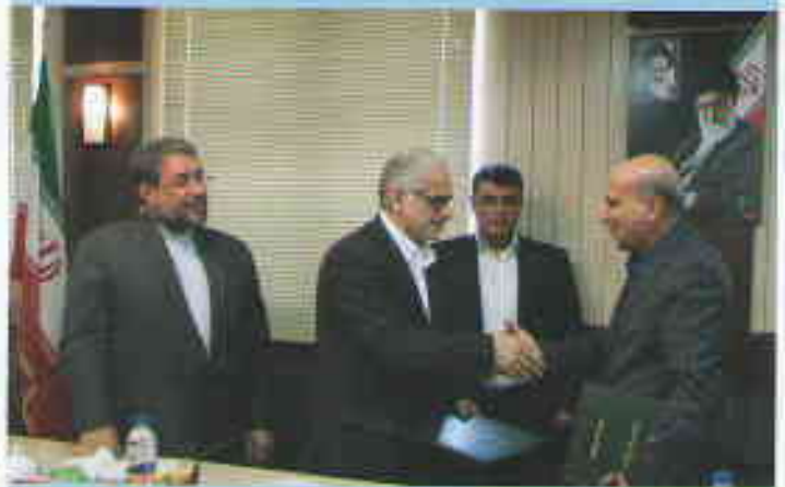
حجت الاسلام و المسلمین سید ابراهیم رئیسی، دادستان کل کشور

ستاد مبارزه با مواد مخدر و دانشگاه پیام نور به مدت دو سال تفاهم نامه همکاری امضا کردند. دکتر علیرضا جزینی قائم مقام دبیر کل ستاد مبارزه با مواد مخدر در مراسم امضای این تفاهم نامه که در سازمان مرکزی دانشگاه پیام نور برگزار شد؛ گفت مواد مخدر یکی از آسیب های مهم اجتماعی است که ایجاب می کند مسوولان امر در مبارزه با آن، با همه اقسار جامعه ارتباط برقرار کنند به ویژه با دانشگاه ها که در حوزه پیشگیری از اعتیاد از اهمیت خاصی برخوردارند. آماری که طی دو سال گذشته در بین دانشگاه های وزارت علوم و بهداشت از اعتیاد دانشجویان جمع آوری شده است، نگران کننده است که می بایست سه موضوع پیشگیری، درمان، توانمندسازی و صیانت را در دانشگاه ها به صورت منجم دنبال کنیم و با این مراکز علمی و آموزشی همکاری تنگاتنگی داشته باشیم.